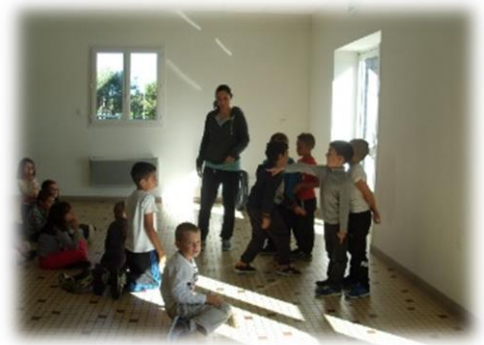
L'arrivée à l'atelier zumba