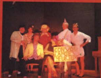
"SOIRÉE THÉÂTRE" samedi 20 janvier 2018