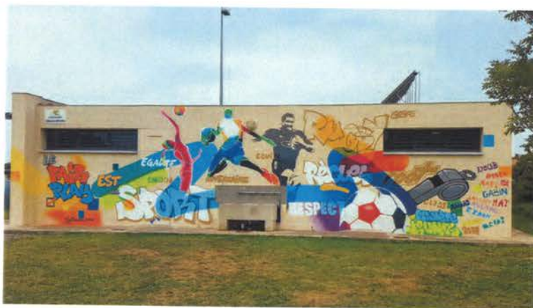
Exemple de la fresque murale réalisée par les jeunes en 2017.