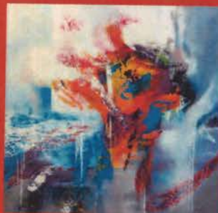
"EXPOSITION MÉDIATHÈQUE" du 20 février au 10 mars 2018