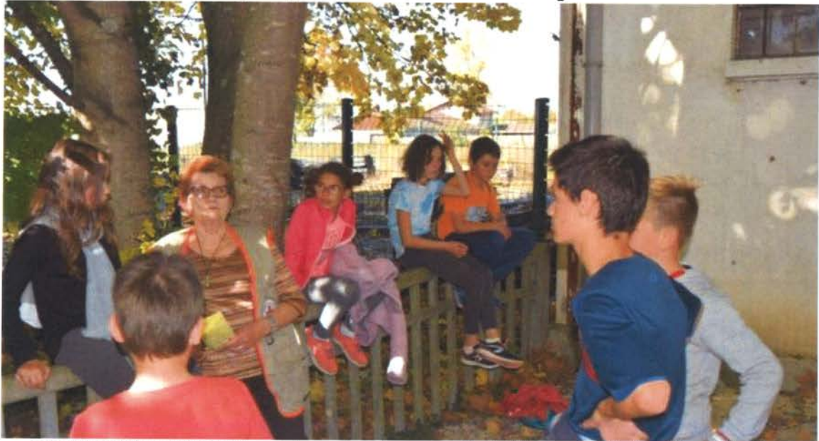
Après avoir apporté leur aide à la Croix Rouge, les jeunes préparent un nouveau «chantier-loisirs» avec la médiathèque.

À chaque période de vacances, l'équipe d'animation du CAP Jeunes met en place un projet de type «chantier-loisirs» qui permet aux jeunes volontaires de bénéficier d'une réduction importante sur leur projet de loisirs ou d'activité culturelle en échange de leur implication dans la réalisation d'une action d'utilité collective. Durant les prochaines vacances, qui se dérouleront du 19 février au 3 mars, c'est un projet de tri de livres et de fabrication de boîte à livres qui sera mené en partenariat avec la médiathèque, la maison de retraite, la crèche, l'ALSH et la Ressourcerie Récobrada et son atelier bois.