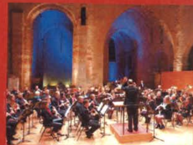
"L'HARMONIE EN CONCERT " samedi 10 février 2018