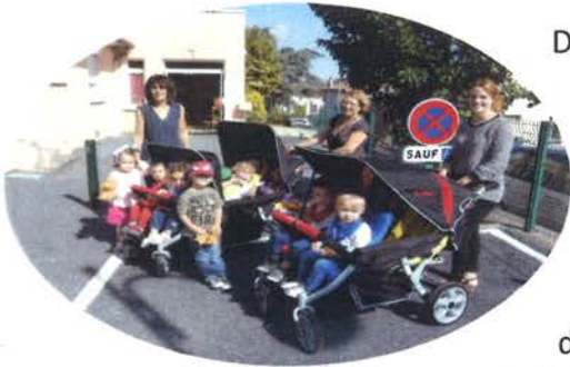
Promenade dans le village

Depuis le 1er avril 2017, l'association des parents gestionnaires du Multi-Accueil « les p'tits bouts » et les communes de Lagarrigue et Valdurenque ont décidé de confier la gestion de l'établissement à une nouvelle association : Loisirs Education & Citoyenneté Grand Sud (LE&C Grand Sud).