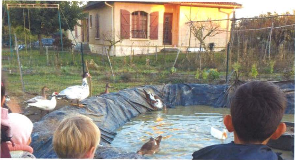
Les enfants de L'ALAE dans le chaudron, situé au pied du château d'eau.

C'est dans le cadre des ateliers périscolaires et du projet éducatif territorial (PEDT) que des ateliers d'éveil à la permaculture ont eu lieu depuis la rentrée avec les enfants de l'accueil de loisirs associé à l'école (ALAE) de Brax le vendredi soir.