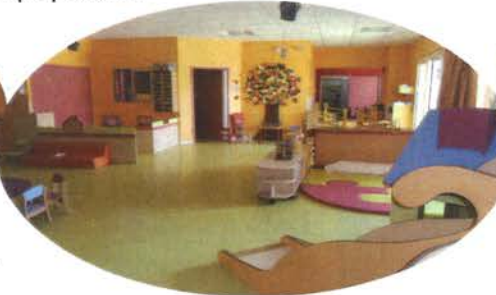
Réaménagement de l'espace