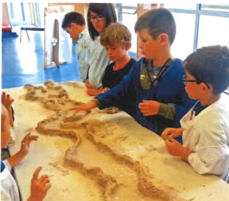
Vacances de février au centre de loisirs