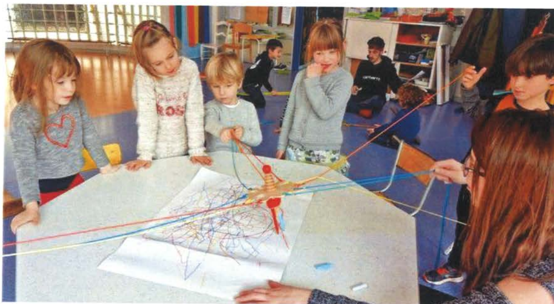
Au centre maternel avec les jeux et jouets en bois prêtés par la ludothèque.