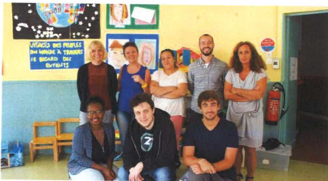
La dynamique équipe des animateurs de l'Alae.

Depuis les derniers changements intervenus en matière de répartition scolaire, l'accueil des loisirs associés à l'école (Alae) s'est structuré et modifié.