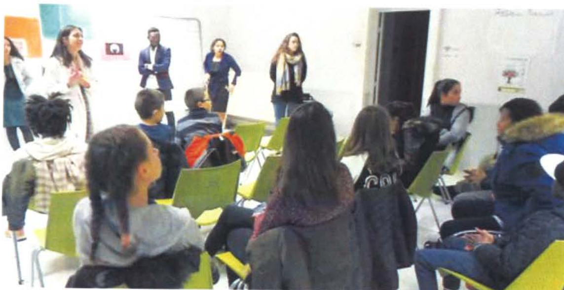
Lors du Ciné-Nomade dans le cadre de la semaine du numérique.

L a semaine consacrée au numérique se terminait par une séance du « Ciné Nomade » proposée par le secteur Prévention Jeunesse de la ville, géré par l'association LE&C GS, partie prenante dans ce projet d'éducation au numérique.