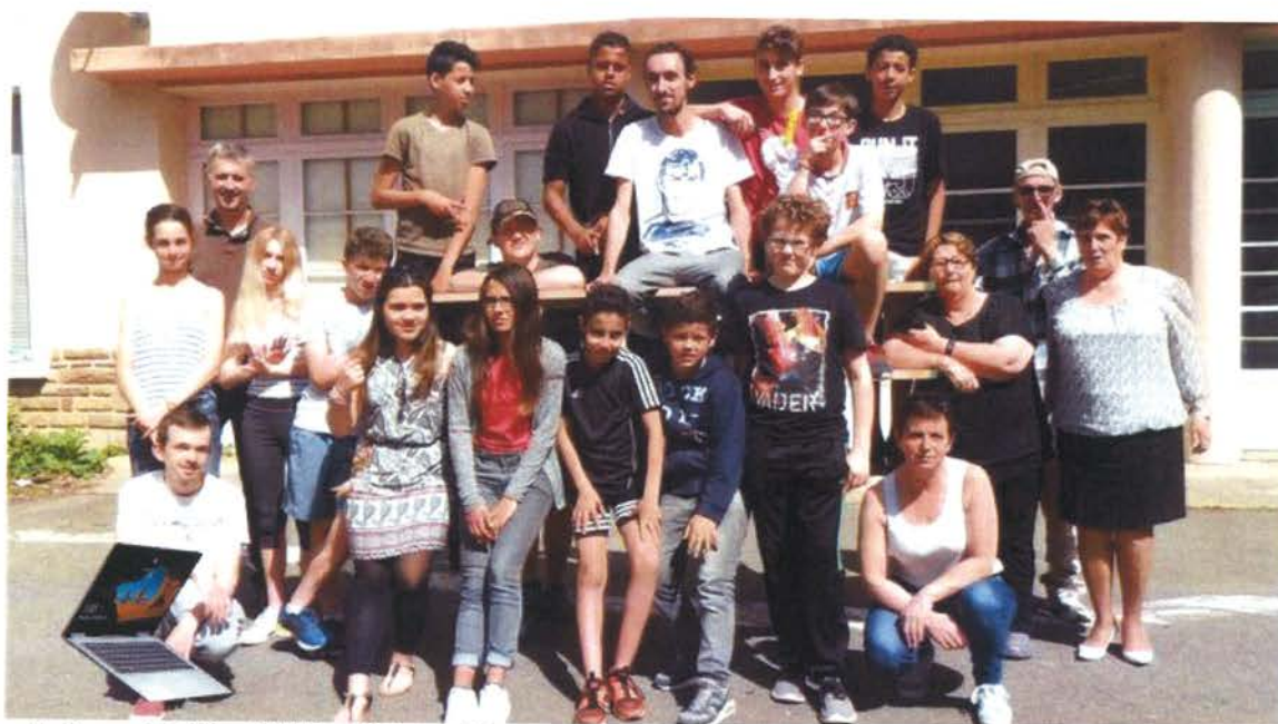
Les jeunes de la MJC et du LEC GrandSud ensemble sur ce chantier solidaire au secours populaire avec les encadrants et les bénévoles.

Dans le cadre de la continuité des chantiers réalisés en avril et juillet, la MJC et l'association LEC Grand Sud ont organisé un chantier jeunes, au Secours Populaire, qui a rassemblé quatorze filles et garçons. Le but de ce chantier était de rénover les locaux du secours populaire. Les jeunes ont participé activement au déménagement. Ensuite ils ont réhabilité du mobilier ancien. Ponçage et peinture étaient au programme. Ils ont également réalisé un présentoir à légumes avec des planches de palettes de récupération. De quoi initier les jeunes au recyclage, au bricolage et stimuler leur créativité.