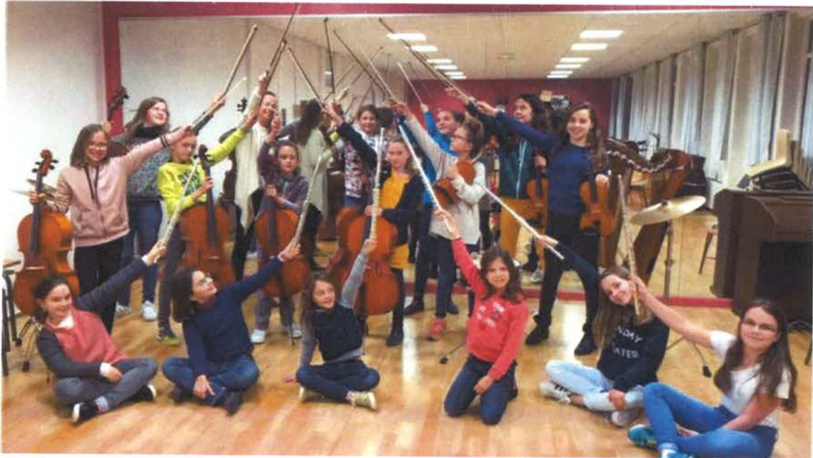
Un pour tous et tous pour la musique avec les élèves de l'EIMSET !

Musiques d'hier, d'aujourd'hui et de demain, l'EIMSET (Ecole intercommunale de musique du Sud-Est toulousain) existe depuis 30 ans sur le territoire. L'événement méritait bien trois jours de célébration dont l'objectif est double : partager de magnifiques moments musicaux mais aussi s'essayer à la pratique de tous les instruments proposés.