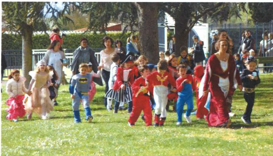
Quelle joie dans ces costumes de lumière.

Organisé par l'ALAE, sous l'égide de Loisirs Education et Citoyenneté Grand Sud, en partenariat avec l'équipe enseignante et le personnel municipal, un très joyeux défilé d'enfants costumés a défilé dans la rue principale du village.