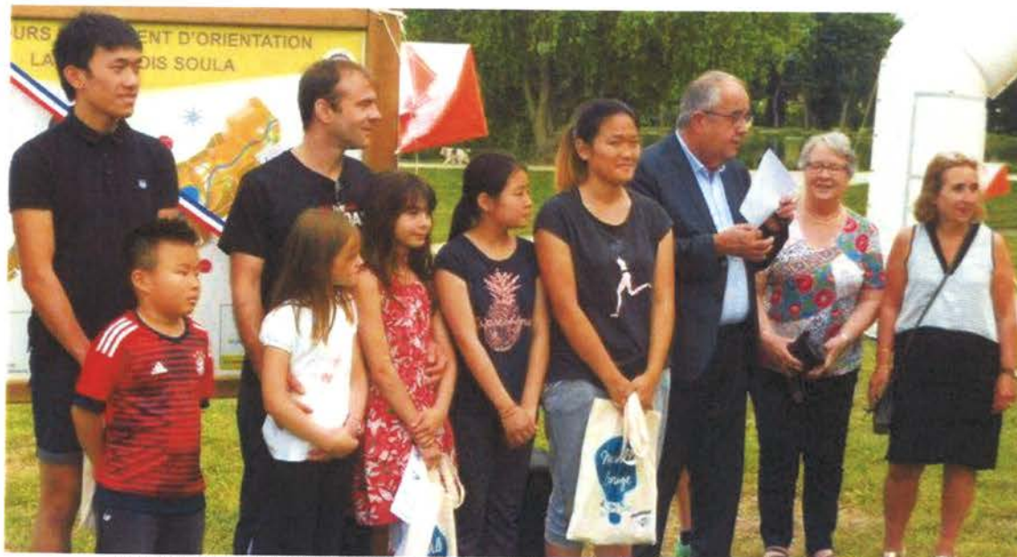
Les premiers gagnants de la course d'orientation avec les élus lors de l'inauguration du parcours permanent d'orientation.

Avant l'inauguration du parcours permanent d'orientation créé autour de l'aire du lac François-Soula, par équipe de deux ou quatre, 140 personnes, familles et enfants accueillis au centre de loisirs, ont testé, sur un parcours unique, la course d'orientation.