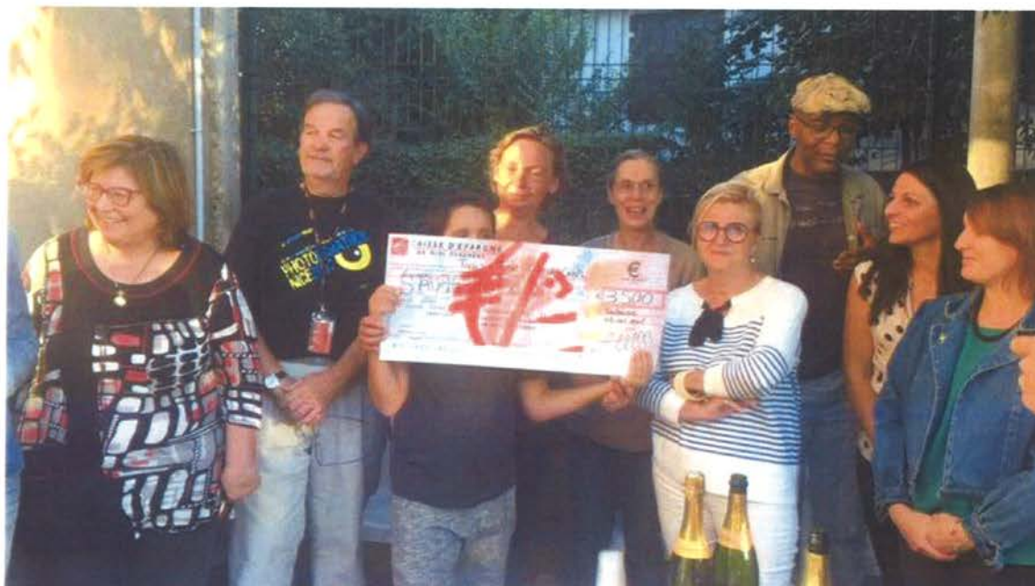
La remise du chèque à l'association Autisme 31.

Banque engagée et solidaire sur son territoire, la Caisse d'Épargne de Midi-Pyrénées continue de lutter contre toutes les formes d'exclusion et vient de remettre un chèque de 3 500 euros à l'Association Autisme 31.