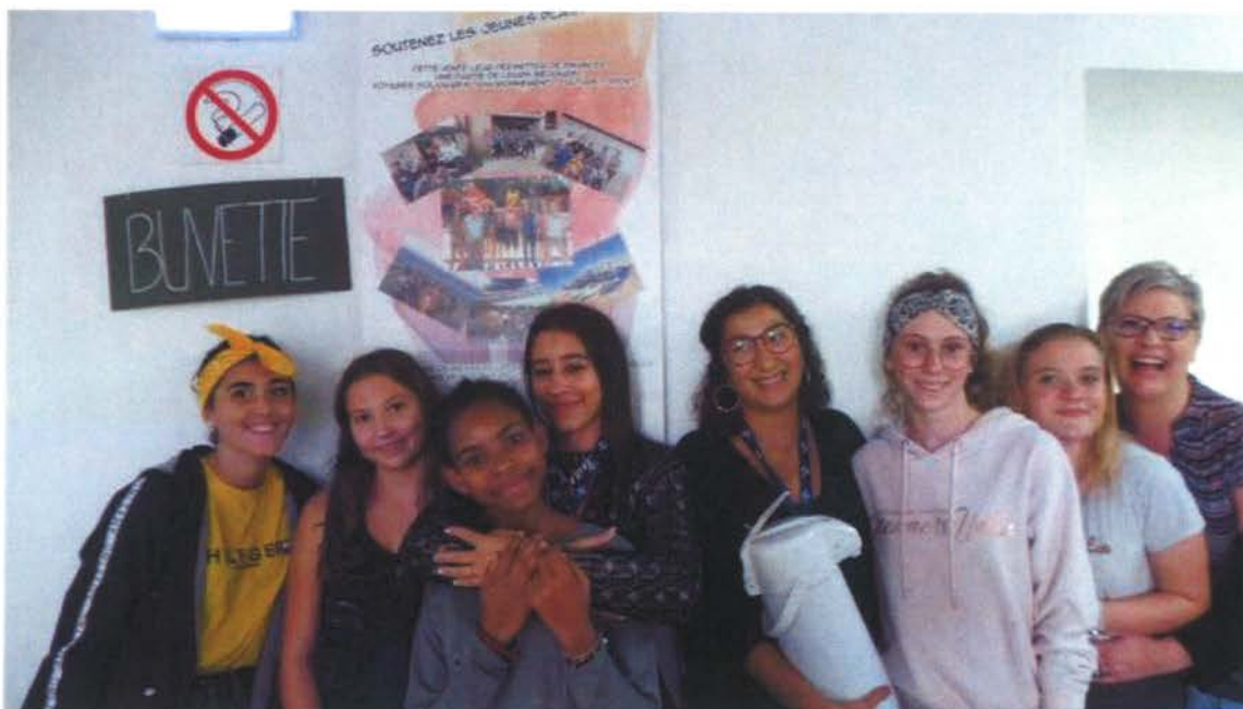
Les jeunes du Point jeune avec leurs animatrices ont tenu un stand lors du salon Artisan'Art.

Durant les deux journées d'ouverture du salon Arisan'Art, un stand décoré et appétissant accueillait les visiteurs et les exposants. Un groupe de jeunes filles adhérentes du Point Jeunes, structure d'animation socioculturelle gérée par l'association Loisirs Éducation et Citoyenneté Grand Sud, s'étaient impliquées dans la tenue de ce stand.