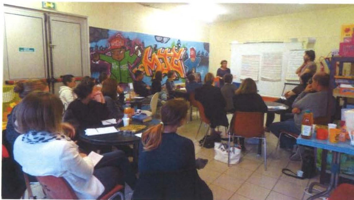
La place des parents dans l'école, vaste sujet de réflexion.

Dans le cadre de sa politique éducative locale, la communauté de communes, avec la MJC Tarascon et Loisirs éducation citoyenneté Grand Sud, a organisé dernièrement un temps de «formation et d'information» à destination des parents d'élèves des écoles du territoire. Ce projet est né de la réflexion d'un groupe de travail, dans le cadre du projet éducatif local, réunissant des parents, des enseignants, des élus, des professionnels de l'animation et des bénévoles associatifs. Il s'inscrit dans la dynamique mise en place avec la MJC Tarascon et LEC GS, en partenariat avec la commune et l'intercommunalité, autour du soutien à la parentalité, dans le cadre du REAAP, dispositif soutenu par la CAF.