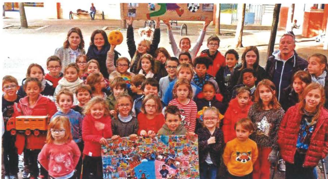
En haut, le panneau réalisé et brandi par les élèves de l'école élémentaire ; en bas, celui des maternels.