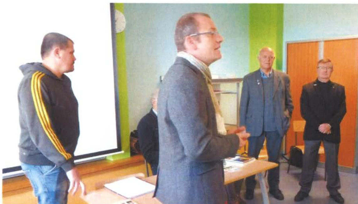
Présentation par le directeur d'établissement.

Un projet expérimental qui préfigure la mise en œuvre d'une unité facultative pour les classes de première baccalauréat SAPAT à la rentrée scolaire 2019 vient d'être lancé au lycée l'Oustal de Montastruc-la-Conseillère.