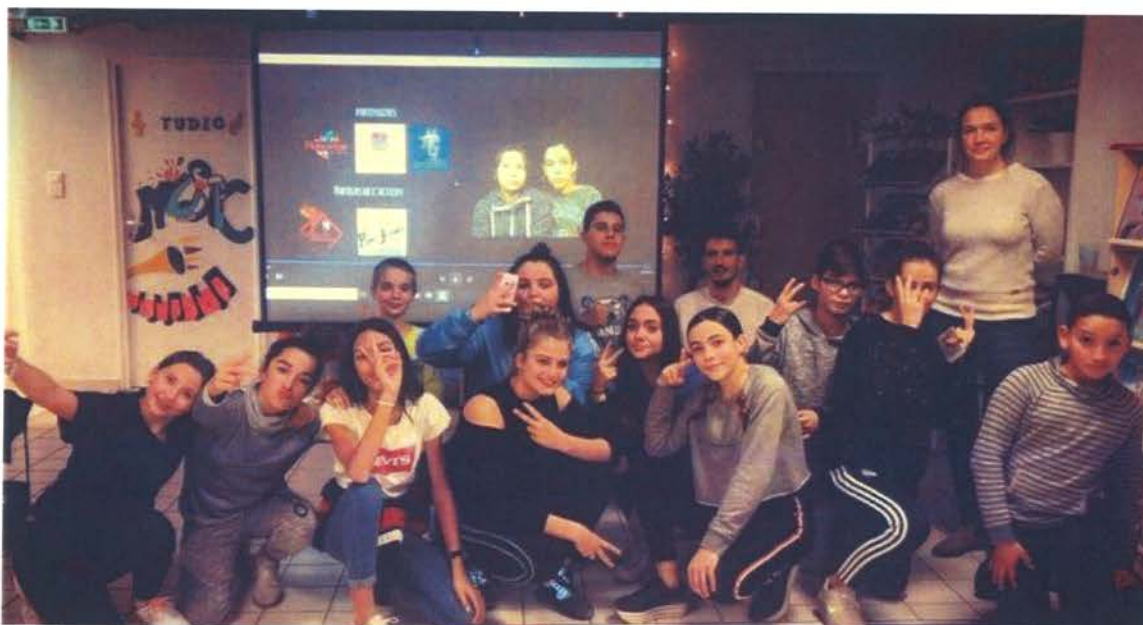
Le groupe de jeunes participants lors de la soirée de valorisation de leur travail sur le thème de l'égalité filles-garçons.

Les équipes des structures «Prévention Jeunesse» et du «Point Jeunes» gérées par l'association «Loisirs Éducation & Citoyenneté Grand Sud» ont proposé aux jeunes plaisançois, de s'informer, se questionner et s'exprimer sur le thème de la laïcité.