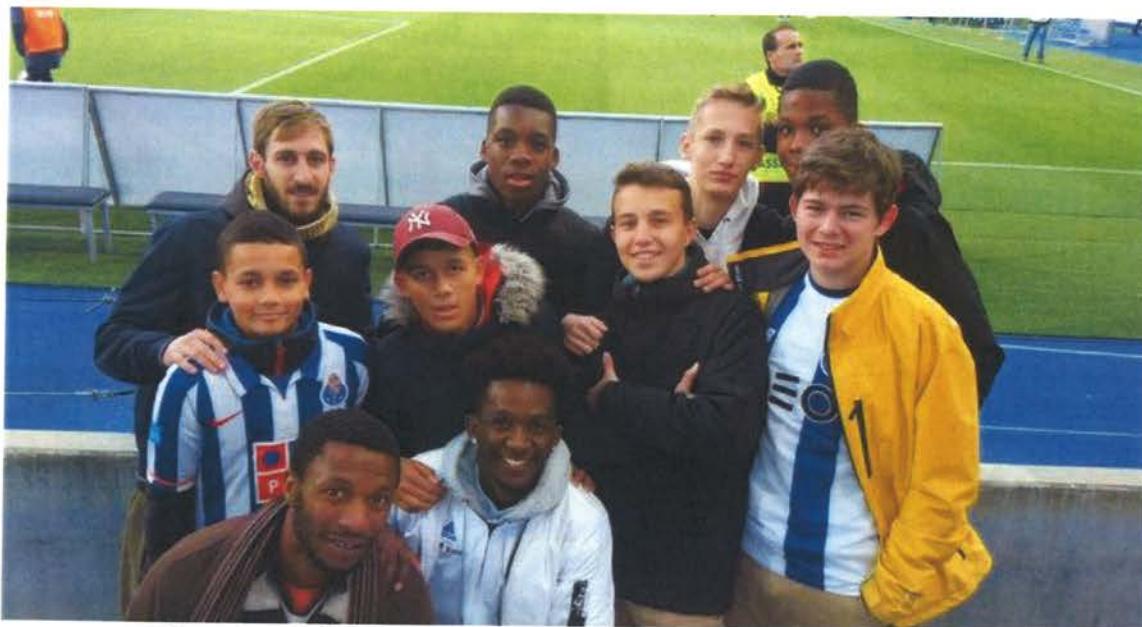
Le groupe au stade du Dragon à Porto pour la rencontre FC Porto contre Feirense.

Dans le cadre des activités du Point Jeunes, la structure d'animation socio-éducative, gérée par le LE&C (Loisirs Education & Citoyenneté Grand Sud, huit garçons de 13 à 18 ans ont concrétisé un projet mûri depuis trois ans.