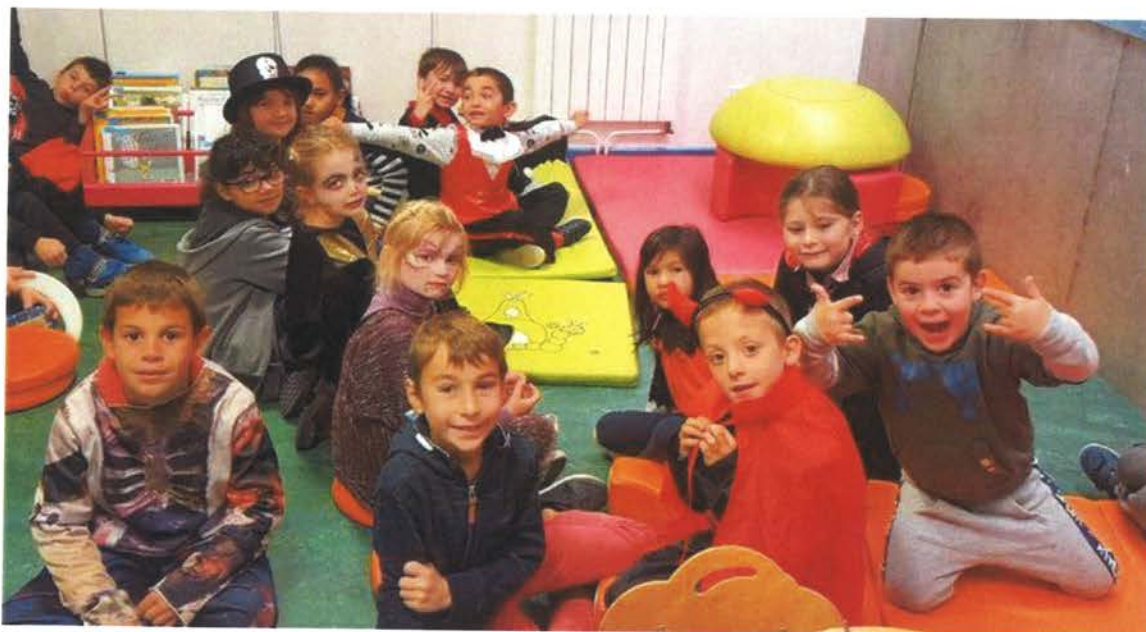
L'ALSH lors des précédentes vacances à la médiathèque.

Durant les vacances de fin d'année, l'accueil de loisirs (ALSH) du pays de Tarascon sera ouvert trois jours, les mercredis 3, jeudi 4 et vendredi 5 janvier.