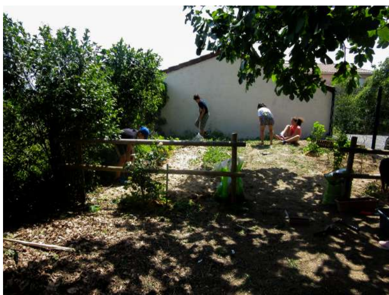
Les enfants de cm1-cm2 en train de donner vie au jardin petit à petit

A: Merci d'avoir pris le temps de répondre à mes questions.