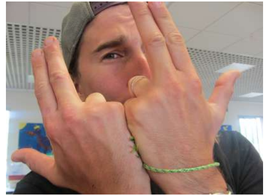
Ses mains ne sont pas vertes!

E&R: Merci d'avoir pris le temps de répondre à nos questions.