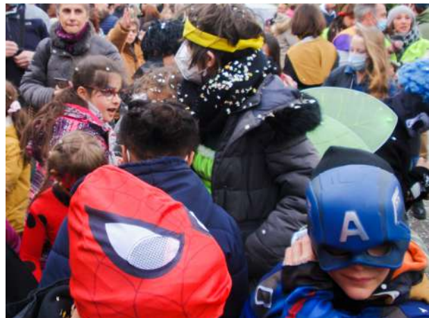
Même les Avengers ne peuvent rien faire contre les confettis