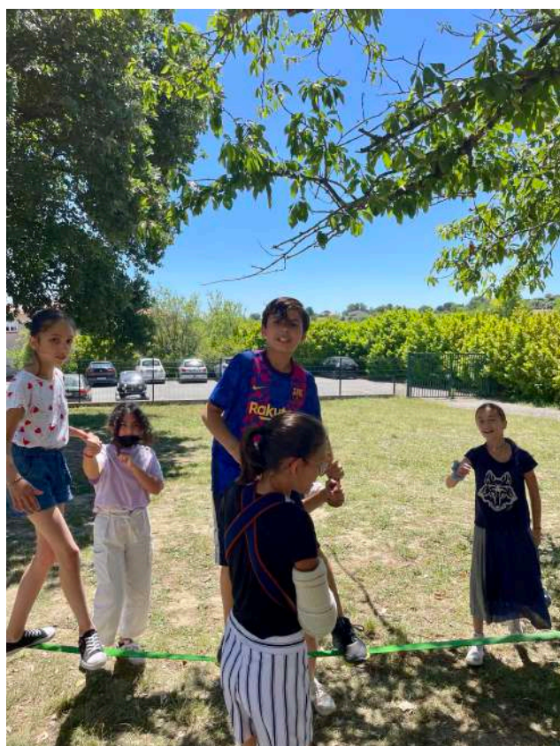
Cela développe la confiance en soi

*Photos prises par les enfantographes de l'alae