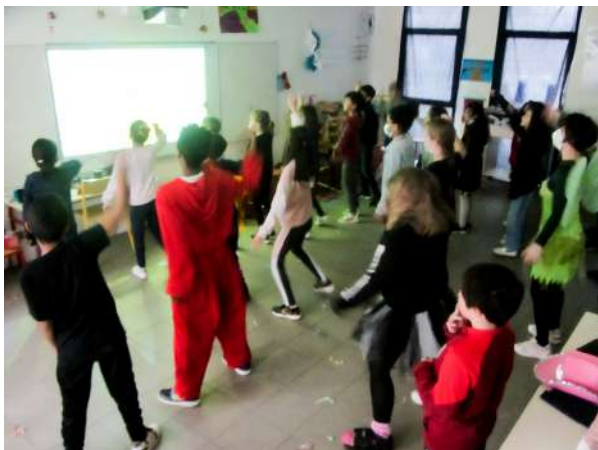
« Juste Danse » entre 12h et 14h

*Article des Journalistes en herbes de cm1-cm2