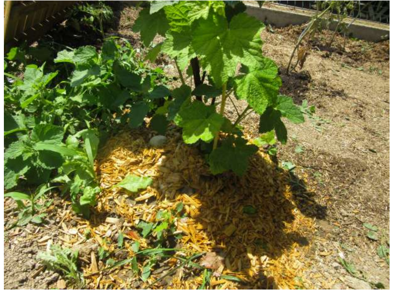
Silence ça pousse...

A: Merci d'avoir pris le temps de répondre à mes questions.