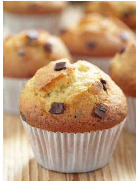
Idéal pour le goûter après une longue journée