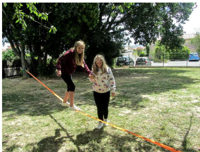
Dernière ligne droite pour les cm2