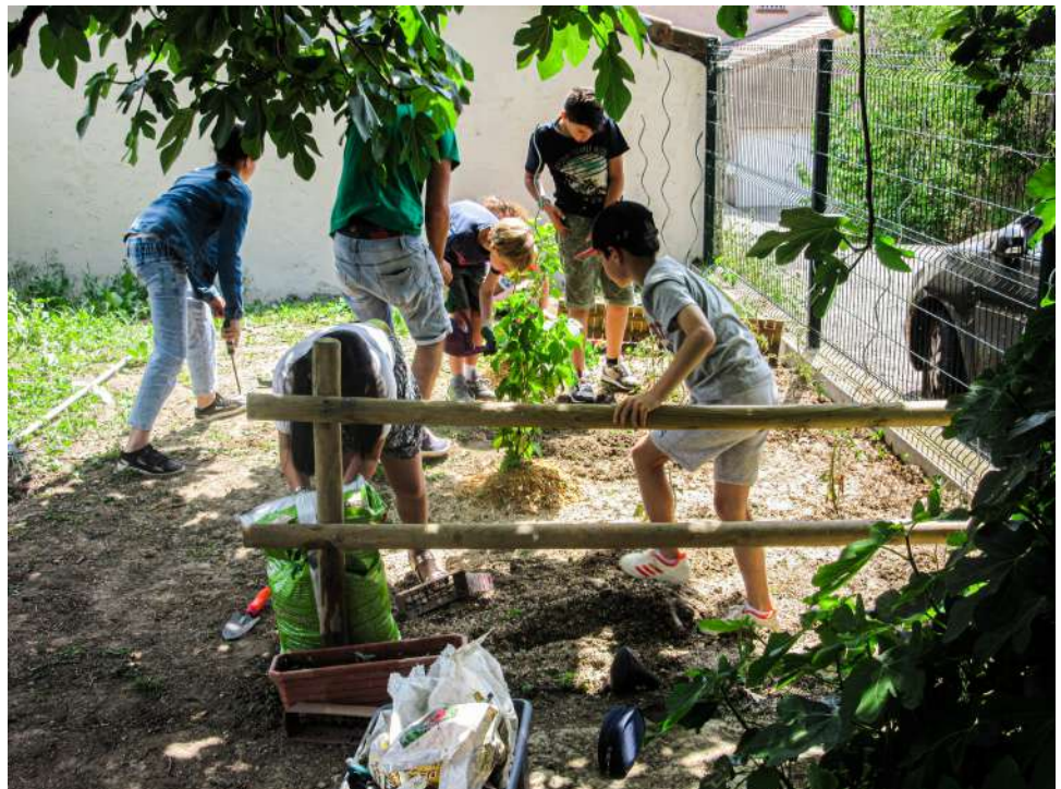
Mais son t-shirt oui!!