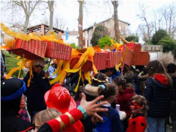
Le dragon et son escorte en tête de cortège

Tout premier événement ouvert aux familles depuis de longues années de pandémie, le carnaval est un moment privilégié pour permettre aux enfants, aux familles et à l'ALAE de se retrouver autour d'un moment festif. Les masques chirurgicaux ont laissé place aux masques colorés d'un carnaval 2022 sous le signe des quatre éléments mais surtout sous le signe des retrouvailles.