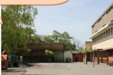
Ecole et ALAE maternelle Joséphine Garrigues