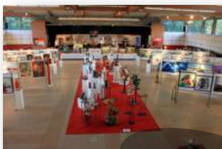
Espace Gérard Philippe