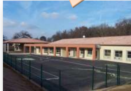
Ecole et ALAE maternelle Balochan