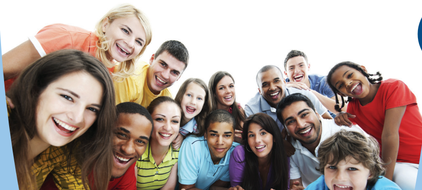
L'AMI - L'Accueil Méthodique pour l'Inclusion

En janvier 2010, ce comité de pilotage a désigné l'Ufvc comme porteur du projet.