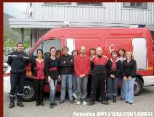
Formation APFS à TARASCON S. MARCÉ

La réforme de la formation professionnelle du 4 mai 2004 offre de nouveaux droits aux salariés. Elle permet en effet à chaque salarié, tout au long de sa vie professionnelle, de développer, compléter ou renouveler sa qualification et ses connaissances.